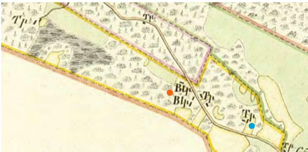
Torpets nya utlagda läge ● på Kristianopel sockenkarta 1854.

WGS 56 14°26.8′ N 15 58°28.5′ E. Femmeryd 9:16.