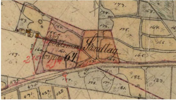
Torpets nya plats efter utläggning enligt laga skifte 1857.

WGS 56 14°26.8′ N 15 58°28.5′ E. Femmeryd 9:16.